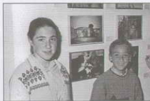
Participantes del 4º Marató