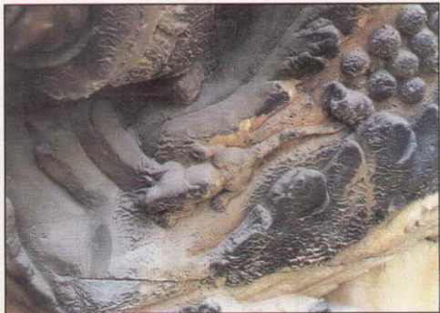
IGLESIA DE NUESTRA SEÑORA DE MONTESION Detalles de la fachada descubiertos durante la restauración