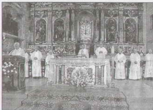
El acto consistió en una misa concelebrada a la que asistieron numerosos familiares y amigos de las jesuitas. Más tarde se sirvió un aperitivo en el claustro.