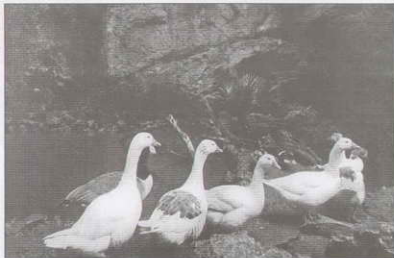
Obras de Paloma Garau (4º C)