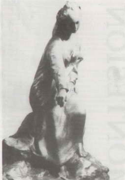
«Nurtidana». Escultura en bronce, que representa a la heroína cantada por Contà i Llibera en «La desxa del geni grec».

Celebradas en Palma de Mallorca 1959 Círculo de Bellas Artes 1977 Círculo de Bellas Artes Salón de Oroño: 2ª medalla (dibujo) 1978 Galerías Almudaina 1979 Galerías Almudaina 1982 Círculo de Bellas Artes 1985 Círculo de Bellas Artes 1989 Sala de Columnas - Montesión 1991 Sala de Columnas - Montesión