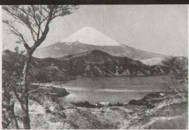
Lago japonesa con el Fushi, monte sagrado del Japón.