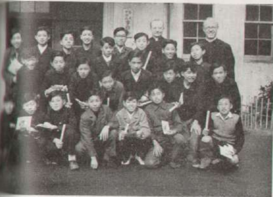
Un grupo de alumnos en el día feliz de su bautismo.