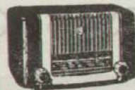
MODELO M 331 A