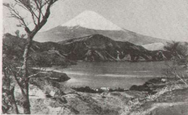
Lago japonés con el Fushi, monte sagrado del Japón.