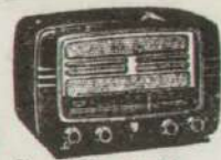
MODELO M 331 A

VEA EXPOSICIÓN ÚLTIMOS MODELOS Y SOLICITE UNA DEMOSTRACIÓN