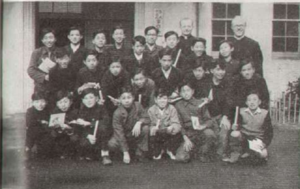
Un grupo de alumnos en el día feliz de su bautismo.