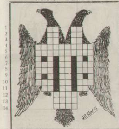
Crucigrama n.º 6, por FE-QU