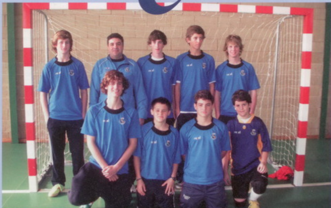
Equipo Cadete, CAMPEÓN DE BALEARES

Es el primer año, éste 2008/09, en el que el Centro asume la organización y dirección del Deporte Federado, en sus secciones de Fútbol Sala y Voleibol. El Colegio apuesta por el deporte, y para ello, ha invertido en la mejora de las instalaciones, con el objetivo, de que nuestros alumnos/as, dispongan de una infraestructura adecuada para la práctica deportiva.