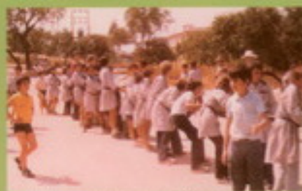
Los alumnos también se ejercitaban con la cuerda