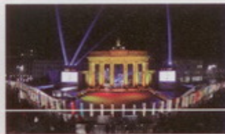
Imágenes del Muro de Berlín, ayer y hoy.

Con esta introducción querría aproximarme a un "hecho histórico" cercano en el tiempo pero que para nuestros alumnos es historia al haber sucedido hace veinte años: la caída del muro de Berlín.