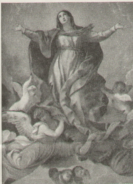
Librame Virgen María

General: Que los progresos de la técnica no disminuyan el sentido de responsabilidad acerca de la propia vida y de la ajena. Misional: Por los Insitutos Católicos de Australia destinados a estudios superiores.