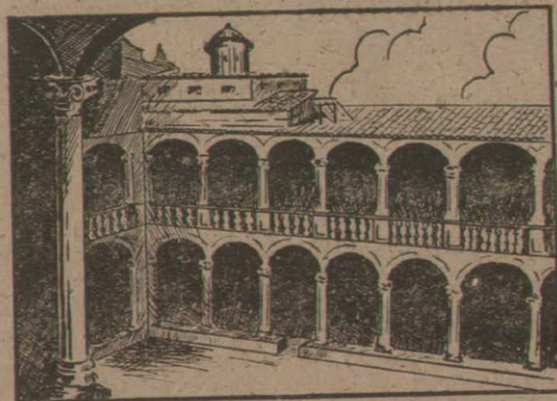
Un ángulo del Claustro