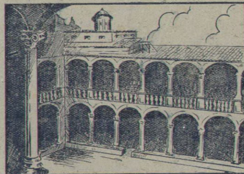
Un ángulo del Claustro