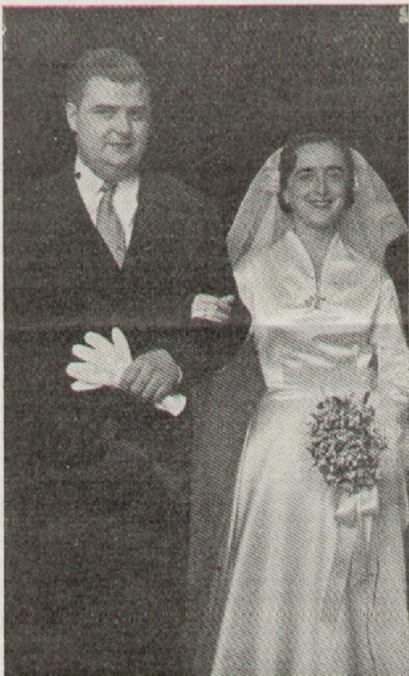
Boda FORTUNY - BOVILLE