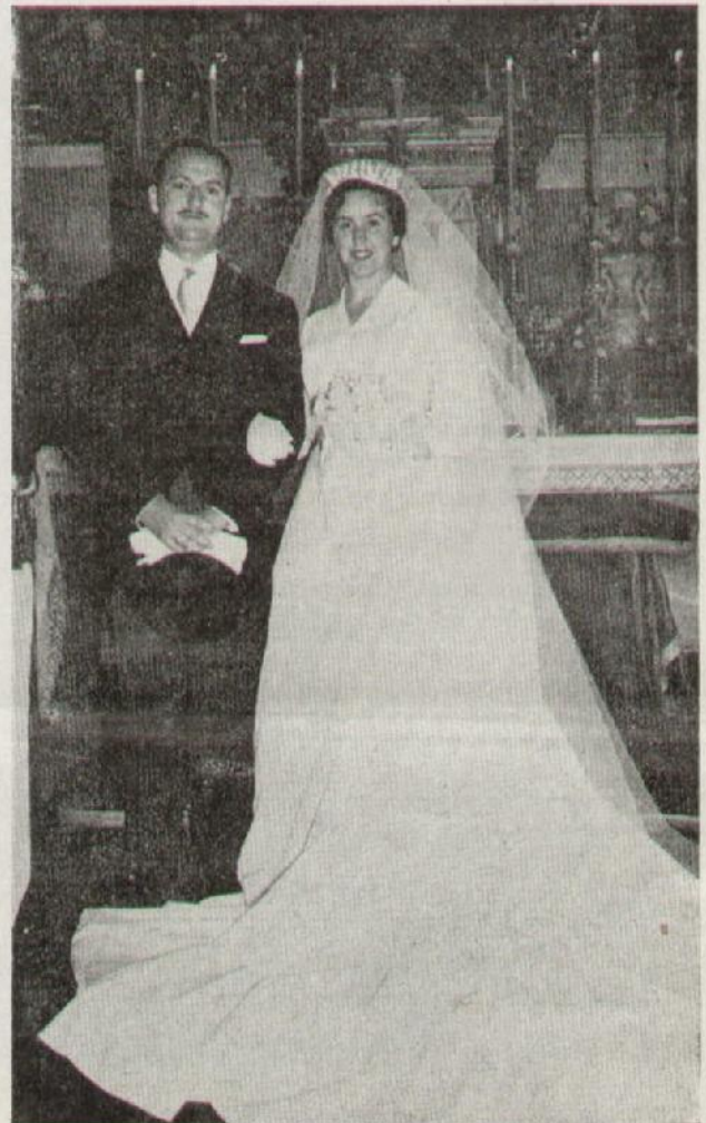
Boda ALBERTI - SALAS

Precio del folleto: 2'50. Pedidos a: Secretaría de Publicaciones. Cuesta de Santo Domingo, 5. Madrid (o encárguelo a su Librería).