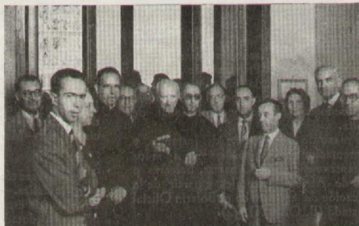
Los Delegados de las Asociaciones españolas de A. A. con el Rdo. P. Asistente de España, y demás directivos de la Federación Europea de A. A.

A propuesta del Presidente de la federación Italiana se acordó por aclamación que el III Congreso de Antiguos de la Compañía, primero tras la constitución de la Unión, se celebrara en 1956 y en España.