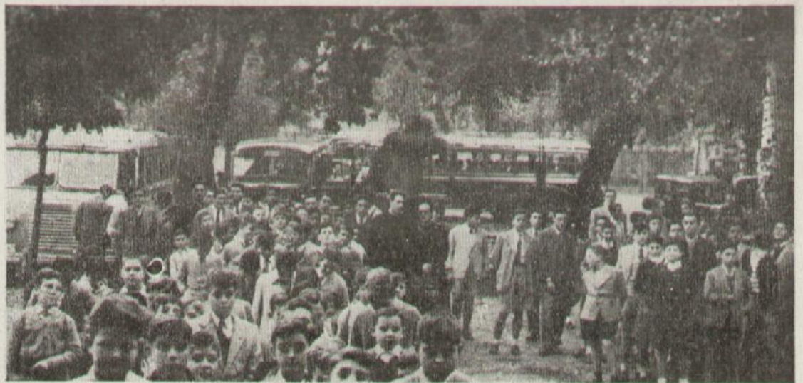
Nuestros colegiales ante el santuario de Lluch

A las 4 y media se recorrió el Rosario monumental rezando y cantando las clásicas decenas, y después de cantar una Salve y de besar los pies de la venerada imagen se emprendió el regreso a Palma a donde se llegó a la luz de las estrellas y con la alegría de haber rendido a la Virgen el debido homenaje propio de este Año Mariano.